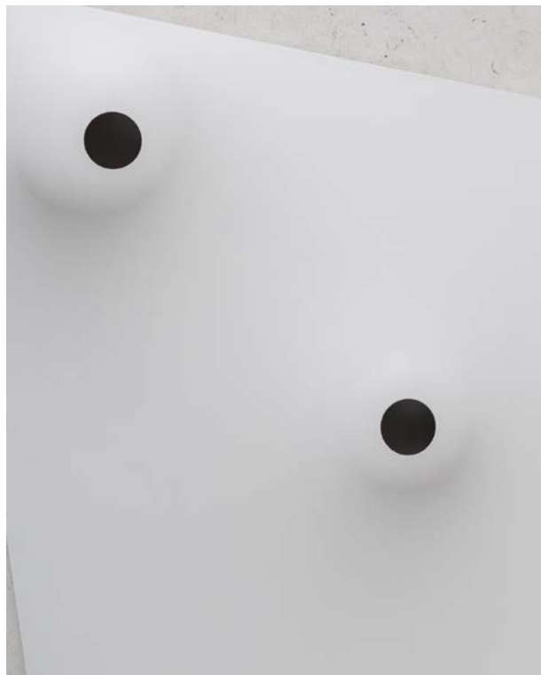
《白のセレモニー - HOLES》

アクリル、綿布、プラスチック型 | 255.3 x 316.5 x 18 cm | 1966/2014