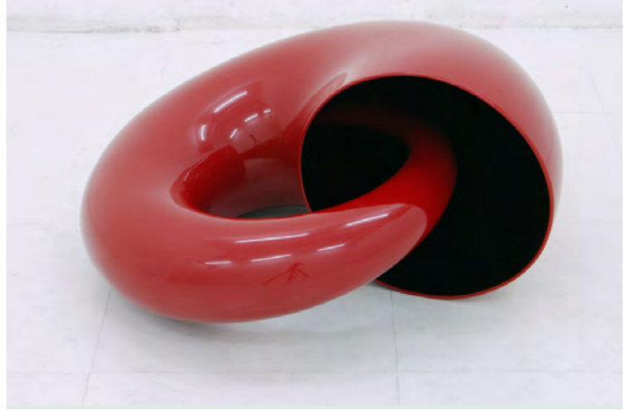
《未知なる消失点》 漆、麻布 | 脱活乾漆技法 27 x φ 56 cm 2010年 個人蔵