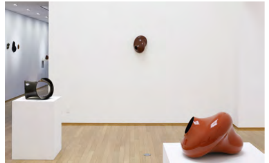
個展「Absence」 アートコートギャラリー、大阪 | 2025年