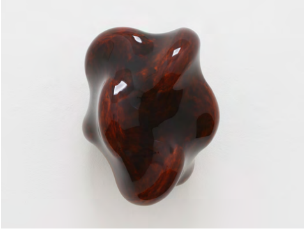
《Taxis Groove (on wall) #13》 漆、麻布 | 脱活乾漆技法 46.8 x 37.2 x 35.1 cm 2025年