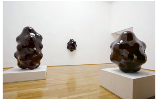
個展「多層皮膜」 アートコートギャラリー、大阪 | 2019年