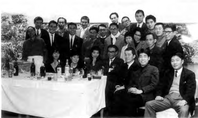
Gutai members at the 13th Gutai Exhibition, Takashimaya Department Store, Osaka, December 1963.

『MAEKAWA』 pp.22-23 | 2014年 初版発行／発行：アクセル・アンド・メイ・ヴェルヴォールト財団