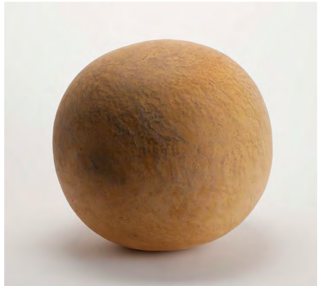
庭の団子 Dango in the Garden