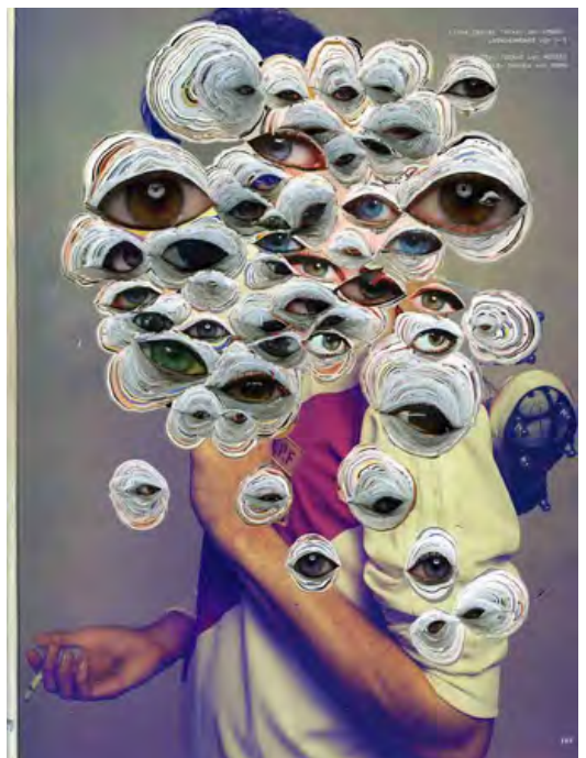
“Feel Your Gravity” 2005 30 x 25 x 1 cm / magazine (参考作品)

Kadist Art Foundation, サンフランシスコ, アメリカ Nasher Museum of Art at Duke University, ノースカロライナ, アメリカ Museum of Old and New Art Tasmania, オーストラリア Artsonje center, ソウル, 韓国 金沢21世紀美術館, 金沢 和歌山県立近代美術館, 和歌山