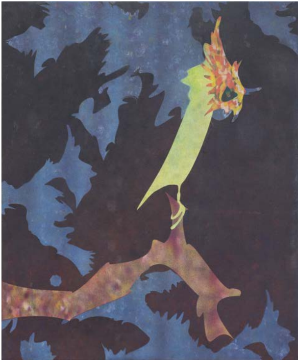
《flicker forest》 2014年、h 72.5 x w 60.7 cm、アクリル、キャンバス

柳澤顕は2011年に京都市立芸術大学大学院にて博士号を取得後、当廊において大規模な個展を開催、香港での国際的なアートフェア「ART HK」でも個展形式で発表し、国内外で好評を得ました。2012年以降は出身地である群馬に戻り、制作の日々を重ねてきた柳澤による約3年ぶりとなる個展を開催します。