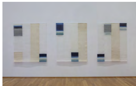
《安東・韓山》2012 | 150×145 / 150×135 cm | 大麻・モシ

協 賛: 三菱地所株式会社、三菱マテリアル株式会社、株式会社三菱地所プロパティマネジメント