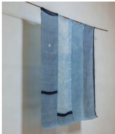
《越後 - 二》《越後 - 一》 2012 | 各160×150 cm | 苧麻

柔らかな布から透き通るように映し出される、ブルーの豊かなグラデーション。福本潮子の藍は、大らかで、宙を感じさせます。淡く白む光から深淵の闇へ、私たちはきっとこんな青い大気に包まれて暮らしている。科学では捉えきれない時空間と美を留め、福本の作品は見る者の本能的な自然感覚を呼び覚まします。