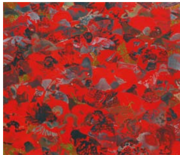
右上：《かくれんぼ 8》 2008年/109.5×054.5 cm