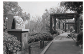
< 野外彫刻展シリーズ “彫刻の小径” > 野外彫刻としては大変珍しく、年に1回 テーマを設けて展示替えを行っています。 【開催中～2009年3月16日】 彫刻の小径2008「空と風と水と」

協賛： 三菱地所株式会社、三菱マテリアル株式会社、オー・エー・ピー マネジメント株式会社